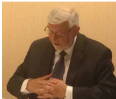
Le Président de l'association, toujours pédagogue envers les adhérents.