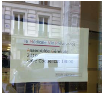
Le lieu de réunion de l'AG est visible depuis l'extérieur pour guider les adhérents.